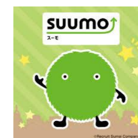
写真をご覧ください!