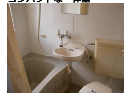
お風呂とトイレは コンパクトな一体型