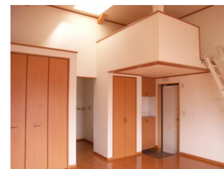
ロフト付きの 広々した洋室