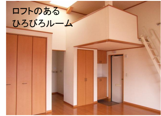
ロフトのあるひろびろルーム