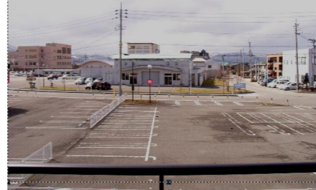
1階 解放間のあるベランダからの景